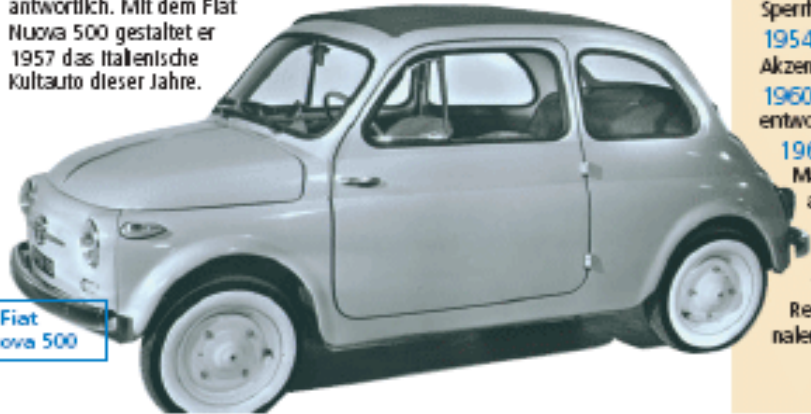
Der Fiat Nuova 500