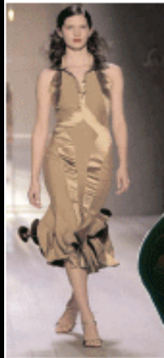
Alta Moda von Salvatore Ferragamo

Salvatore Ferragamo wird 1898 als erstes von vierzehn Kindern in einem kleinen Dorf bei Neapel geboren. Im zarten Alter von 13 Jahren eröffnet er seine erste Schuhmacheret und reist mit 16 in die Vereinigten Staaten, um dort sein Glück zu machen. Der amerikanische Traum wird wahr. Schon bald nimmt er Aufträge aus Hollywood entgegen: Er produziert das Schuhwerk für antike Dramen und Cowboystiefel für Westernfilme. Doch Stars wie Rita Hayworth, Ingrid Bergmann und Ava Gardner wollen auch jenseits des Sets nicht mehr auf die Kreationen Ferragamos verzichten – Greta Garbo soll ihn in Florenz aufgesucht haben, um 70 Paare des gleichen Modells zu bestellen.