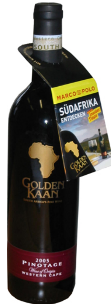
Marco Polo Reiseführer als Flaschenanhänger