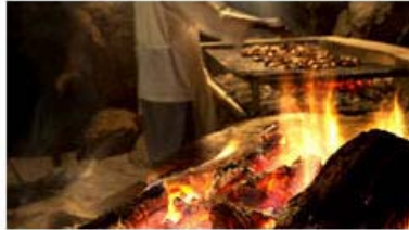
Wacky Wine Festival: Hervorragende Tropfen und köstliche Gourmetgerichte Robert Haidinger

Erst sechs Jahre und schon so groß! Das wird wohl nicht zu Unrecht über das Wacky Wine Festival gesagt, lockte es doch allein letztes Jahr 10 000 Besucher ins Robertson Valley. Anfang Juni, pünktlich zu Winterbeginn, findet dort Südafrikas größtes Weinfest statt – eine mehrere Tage andauernde Party, bei der es weder an hervorragenden Tropfen mangelt noch an Gourmetgerichten. Vielfältig ist auch das Ambiente, in dem all diese Köstlichkeiten serviert werden.