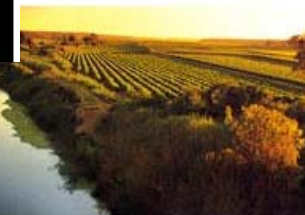
Manche Weinfarmen servieren zu ihren Weinen auch Flusswasser.

llziehbare Gründe, anderthalb Stunden aufs Gaspedal zu steigen und die Route 62 hinauszurollen gibt es auch an allen anderen Tagen des Jahres. aße führt östlich von Kapstadt Richtung Kleine Karoo und schließlich weiter den Route. Dass es der liebe Weingott gut gemeint haben muss mit Flecken südafrikanischer Erde, erkennt man dabei leicht – es reicht ein Blick aus dem Wagenfenster. Alte Pfefferbäume säumen die ehemalige aße, und im Frühling senkt sich eine wahre Wildblumenwolke über die l, beschert den Tälern und Wiesen einen mittleren Farbenrausch.